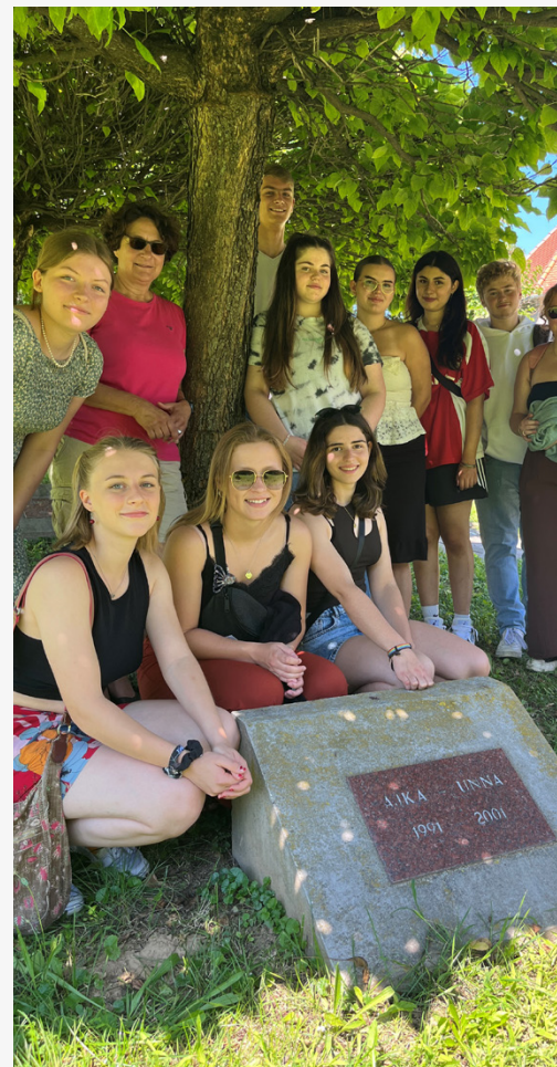
➤ Mitglieder des Unnaer Jugendrates folgten im August der Einladung des Jugendrates von Unnas Partnerstadt Ajka nach Ungarn.